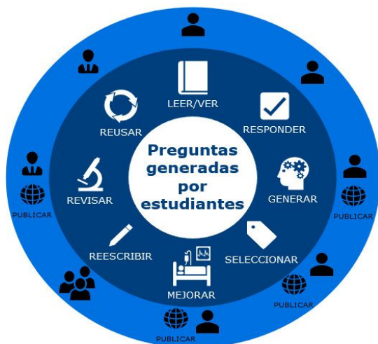
Figura 1: Las fases semanales del SGQ, empiezan en leer/ver y siguen hacia la derecha hasta reusar.

En esta sección explicaremos cómo hemos aplicado el método. Los estudiantes trabajan con textos elaborados por los profesores a partir de libros y con videos de diferentes formatos. Como soporte online hemos usado formularios drive para recopilar datos y documentos de texto drive para compartir información sobre las preguntas elaboradas.