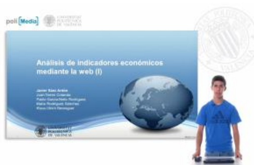
Figura 2: Imagen de la comunicación oral.

Finalmente, la última jornada, tras una última reunión de discusión de resultados, les animamos a que documentaran el trabajo realizado, con el objeto de fomentar su capacidad de síntesis y comunicación escrita. Les pusimos como ejemplo la estructura típica de una comunicación científica escrita con la idea de que reprodujeran sus puntos a una muy pequeña escala. Cabe señalar que este aspecto fue el que peor acogida tuvo por su parte. Expresar ideas por escrito no es uno de los puntos fuertes de nuestros estudiantes de bachiller aunque hay que señalar a su favor, que esta tarea, a realizar en su último día, se vio eclipsada por el requerimiento de la Universidad de grabar un vídeo relatando su experiencia (Figura 2), lo cual, obviamente, resultaba mucho más atractivo e interesante para ellos [3].