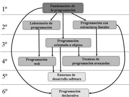
Figura 1: Mapa de dependencia (por semestres) de las asignaturas del módulo de programación de la titulación de Grado en Ingeniería Informática de la UEM.

La asignatura de fundamentos de programación es la primera asignatura en la que los alumnos se enfrentan a una nueva forma de estructurar el pensamiento: deben entender las estructuras de control y de datos, y aplicarlas en la resolución de problemas. Para ello no deben sólo ser capaces de identificar y aplicar una fórmula dada, sino que la mayoría de las veces tienen que inventar o adaptar un algoritmo.