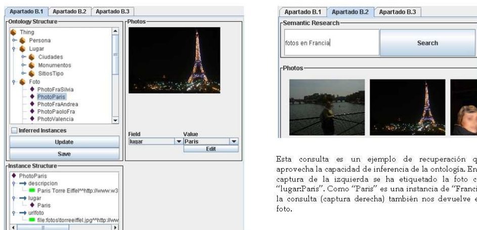
Figura 2. Herramienta de anotación (izquierda) y recuperación (derecha) semántica de fotografías (Apartado B).