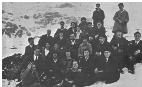
Figura 3. La Institución Libre de Enseñanza fomentaba el contacto con la naturaleza. En la foto aparecen alumnos y profesores de la ILE en una excursión al Pirineo de Huesca.

“La nueva Universidad, cuyas líneas poco a poco van dibujándose en nuestro tiempo, tiende a ser pues, un microcosmos. Abraza toda clase de enseñanza; es el más elevado instituto de investigación cooperativa científica; prepara, no solo para las diversas profesiones sociales, sino para la vida, en su infinita complejidad y riqueza. Estimula al par, con la vocación al saber, la reflexión intelectual y la indagación de la verdad en el conocimiento, el desarrollo de la energía corporal, el impulso de la voluntad, las costumbres puras, la alegría de vivir, el carácter moral, los gustos sanos, el culto del ideal, el sentido social, práctico y discreto de la conducta”