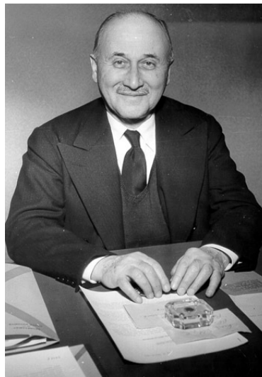
Figura 1. Jean Monnet, uno de los impulsores de la idea de una Europa unida

región francesa de Cognac, viajó desde muy joven por todo el mundo como representante de licores.